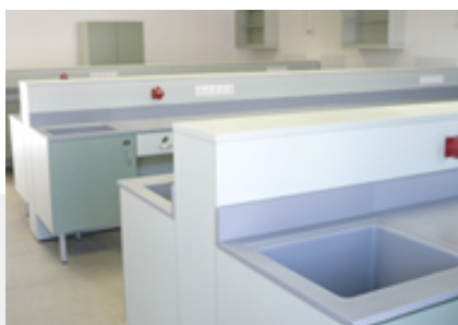
Főiskolai labor - Gyöngyös DURCON® Epoxy-Resin munkalap

Tükrözőny lapraszerelve. PARAPAN® termékeink nem hagynak kívánni valót a magasfény tekintetében. Méretre gyártott alkatrészeket szállítunk egyedi igényekre is.