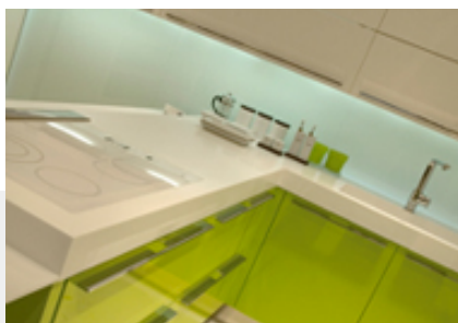
Bemutató konyha - minden fehérben SAMSUNG STARON Pure White

Tervezői ötleteket megvalósítva építünk egyedi bútorarabokat vagy egész berendezéseket, melyek hangsúlyozzák a különleges lakó- és életminőséget.