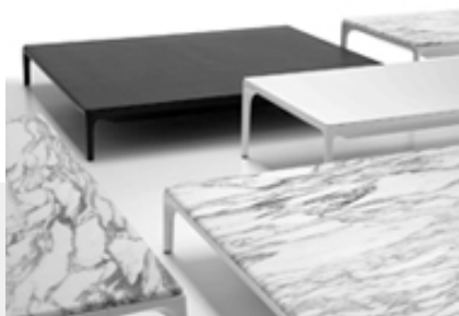
Különbéféle bútorok lakóterekbe Az ÁDH lapok széles kínálatából