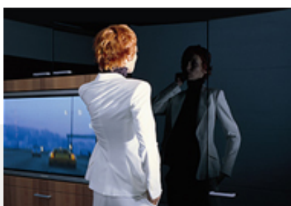
Hibátlan magasfény, tökéletes tükröződés PARAPAN® tükrözőnyes bútorfelületek

A vendéglátásban és szállodákban felületeink megbízhatóságuk és tartósságuk miatt állandó vendégnek számítanak. Minden akril lapunk NSF I-5 bizonylattal rendelkezik.