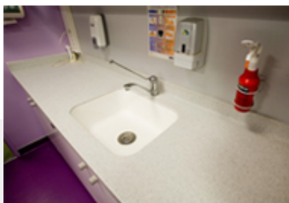
Ahol a higiénia elsődleges szempont ÁDH lapok az egészségügyben