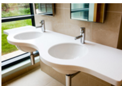
Dupla íves mosdópult SAMSUNG STARON Bright White

Családi életünk középpontjába, az otthoni konyhába, funkcionális és tökéletes felülettel rendelkező megoldásokat fejlesztünk és alkalmazunk.