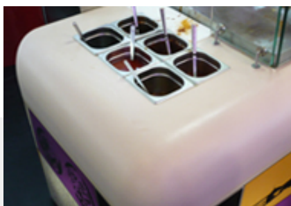
Thai gyorsétterem - Karlovy Vary HANEX Ivory

Higiénia, tisztíthatóság, enyhe ívek és a vegyszerállóság azok a kulcsszavak amelyek a kórházi és rendelői felhasználás mellett szólnak. Az ÁDH lapok előnyei itt is meggyőzőek!