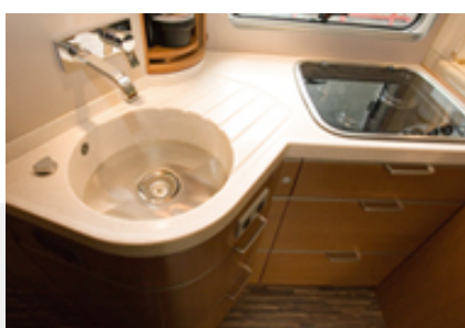
Magas minőség a járműgyártásban HYMER lakóautó exkluzív pultja

Az iskolai és kutatóintézeti laborpultok a legtöbbet követelik a munkafelülettől. Ebben az esetben jut főszerephez a DURCON® Epoxy-Resin munkalap anyagunk.