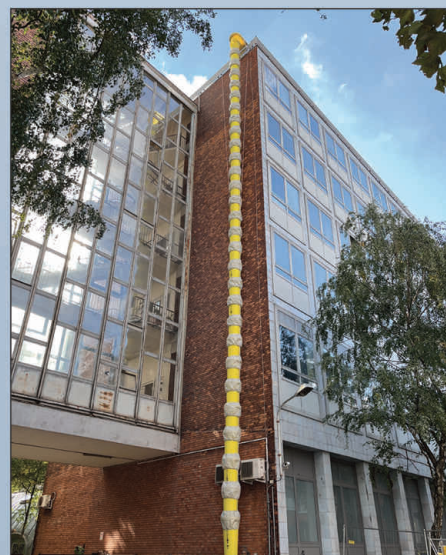
Budapesti Műszaki Egyetem