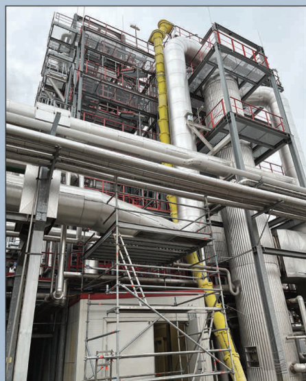
Pannonia Bio finomító