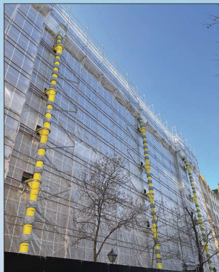
Magyar Nemzeti Bank