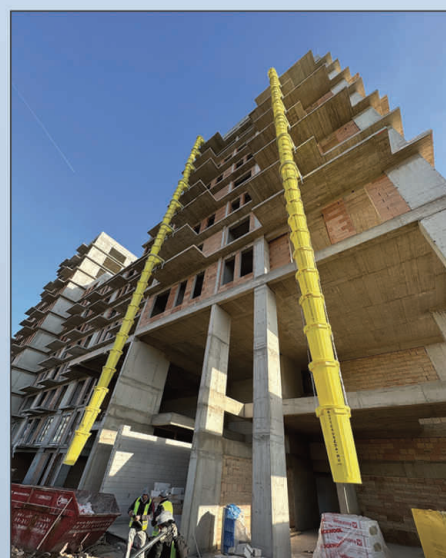
City Pearl Lakópark